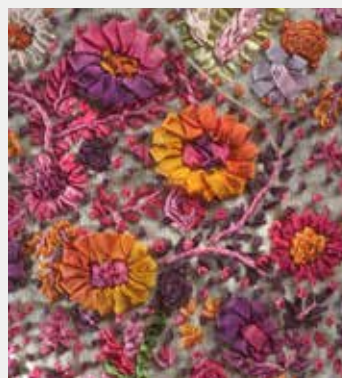
Détail d'un tailleur brodé de rubans par Maurizio Galante, 2009, collection MAI

Le trésor de rubans du musée sort de ses réserves et s'offre à profusion dans cette exposition. L'ingéniosité des techniciens textiles et des grands