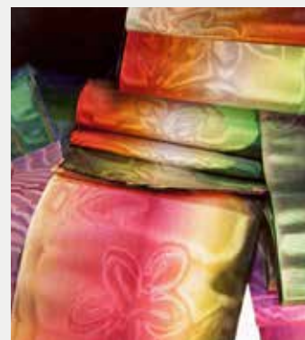
Rubans de soie, Colcombet Fr. et cie, 19 e siècle, collection MAI

ouvriers, la forte personnalité et la clairvoyance de fabricants ouverts à la novation a généré la surprenante diversité de cet indispensable accessoire. D'emblée internationale grâce aux savoir-faire commerciaux des industriels, la vente des rubans se révélait extrêmement rémunératrice. Jamais à cours de créativité, les fabricants ont adapté les articles aux visages changeants de la mode et à de nouveaux usages techniques et industriels. Cette base culturelle très riche liée au métier représente un capital productif toujours sollicité aujourd'hui.